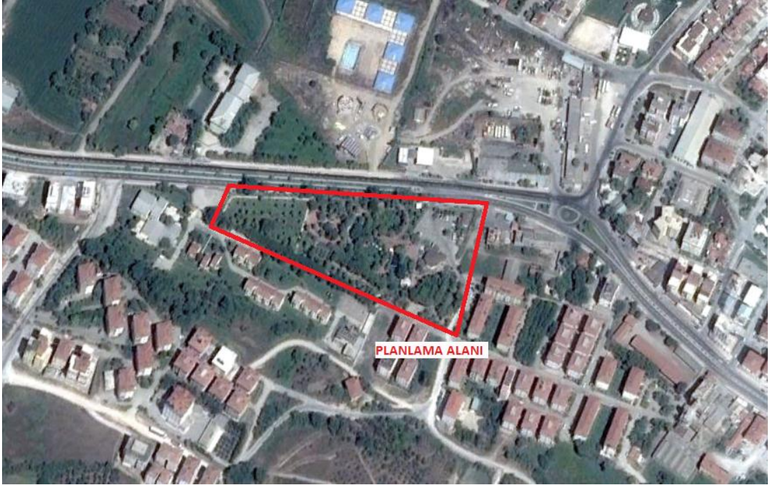
Planlama alanı

Bursa İli, Mustafakemalpaşa İlçesi, H20c 23b 2c ve H20c 24a 1d pafta, 437 ada, 244 parsel 1/1000 ölçekli Mustafakemalpaşa Uygulama İmar Planında park, yol ve otopark alanında kalmaktadır. Alanın kuzeyinden 35 m ana ulaşım aksı geçmekte olup bölgeye ana ulaşım bu yoldan sağlanmaktadır. Alanın doğusunda 12 m yol ve otopark planlıdır.